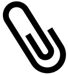
Tableau des prestations

La Prestation canadienne d'urgence (PCU) consiste en une allocation de 500 $ par semaine pendant un maximum de 24 semaines du 15 mars au 3 octobre 2020. Cette mesure a été prise afin de simplifier les mécanismes d'aide et d'accélérer le traitement des demandes et parce que le régime d'assurance-emploi n'a pas été conçu pour traiter le volume sans précédent de demandes reçues. Optez pour le dépôt direct afin d'obtenir votre prestation rapidement. Faites votre demande de PCU en ligne au https://www.canada.ca/fr/services/prestations/ae/pcusc-application.html ou par téléphone à l'aide d'un service téléphonique automatisé : 1-800-959-2041 ou 1-800-959-2019.